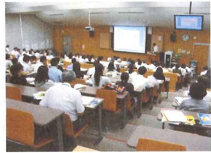
平成23年度著作権セミナー開催の様子