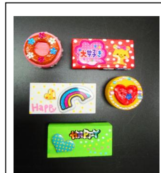
【子どもたちが作製 したマグネット】