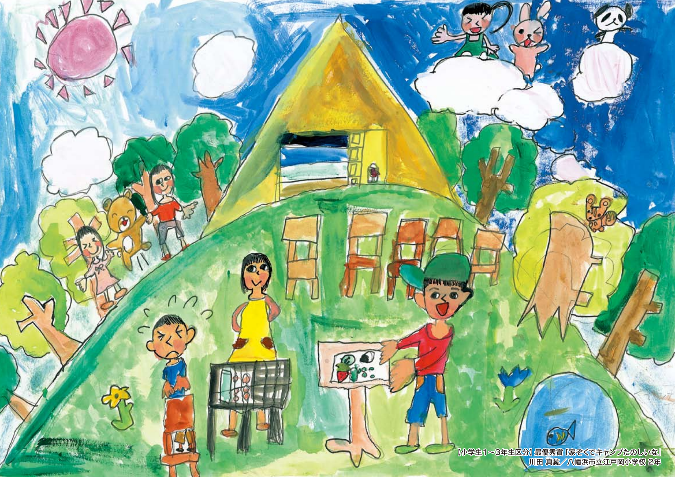
【小学生1~3年生区分】最優秀賞「家ぞくてキャンプたのしいな」 川田 真紘 / 八幡浜市立江戸岡小学校 2年