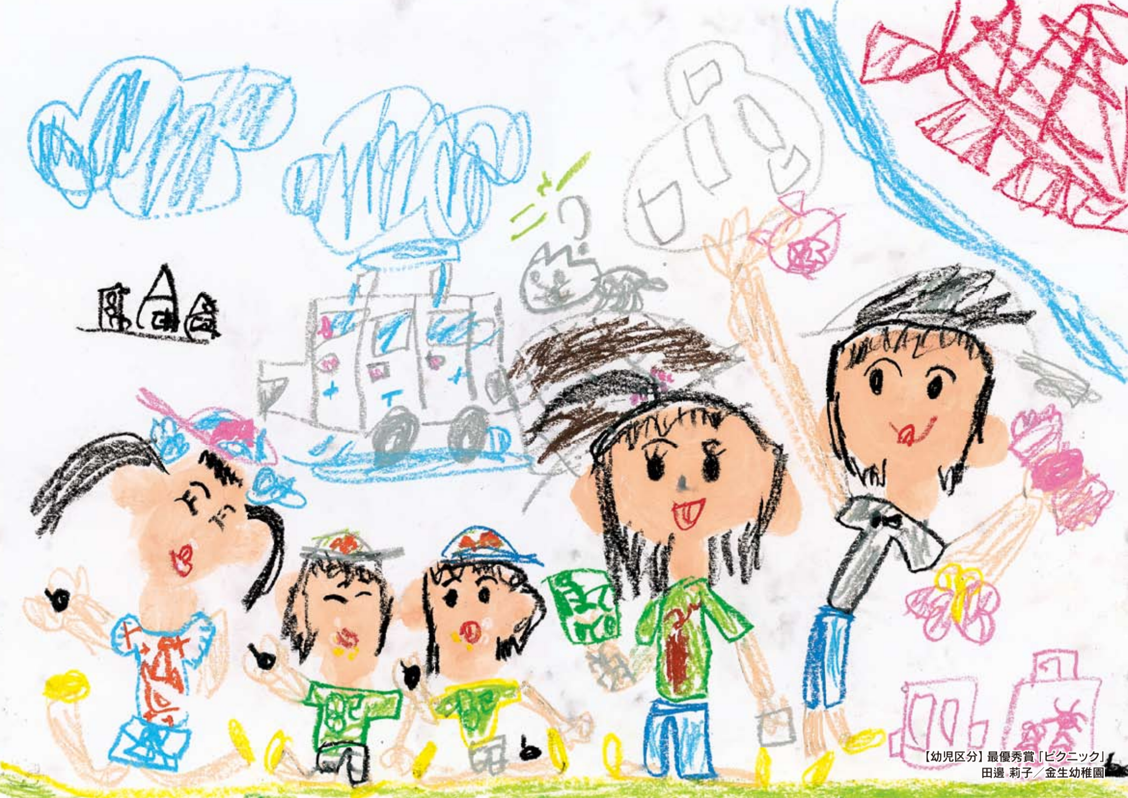
【幼児区分】最優秀賞「ピクニック」 田邊 莉子 / 金生幼稚園