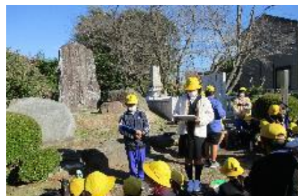
【塩田ウォークガイドになろう】