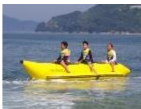
【マリンスポーツ体験】