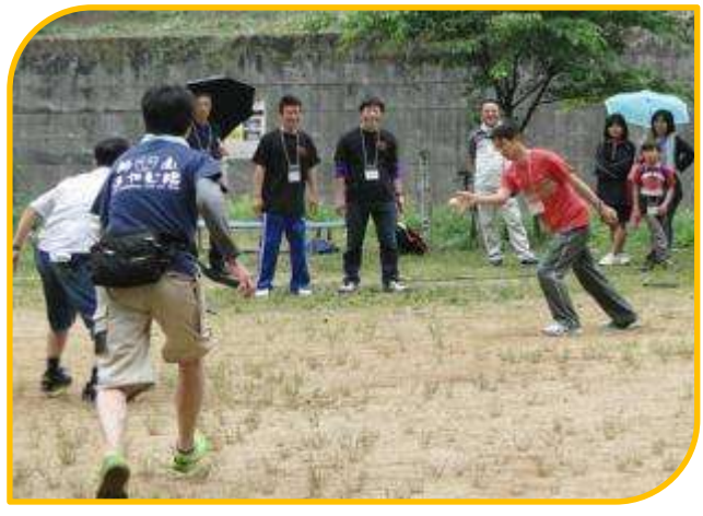
今だ！打て！走れ！守れ！