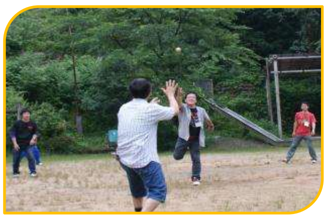
いい球が来たら、打ってやるぞー

お父さん世代なら「ろくむし」の記憶がある方も多いでしょ。柔らかいボール一つで暗くなるまで遊んだ思い出を胸に、ルールを確認しながら必死になって走りました。