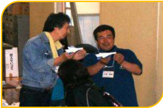
お互い、なかなかいい出来ですな

よく飛ぶ紙飛行機を追求 したいのは、大人も子ども 同じです。作るときには真剣 に、飛ばすときには笑顔いっ ぱい。みんなでワイワイ言い ながら、究極の紙飛行機作り が繰り広げられました。