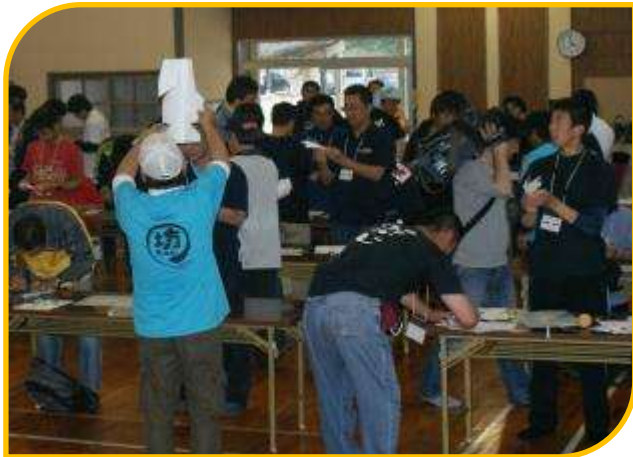
分かりやすい説明の仕方をも井戸端会議