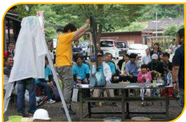
大気のかで5 kgのバーベルが持ち上がる

直径2mの巨大風船や掃除機、アクリル板、脚立などたくさんの実験器具をもって分かりやすく大気圧について学びました。