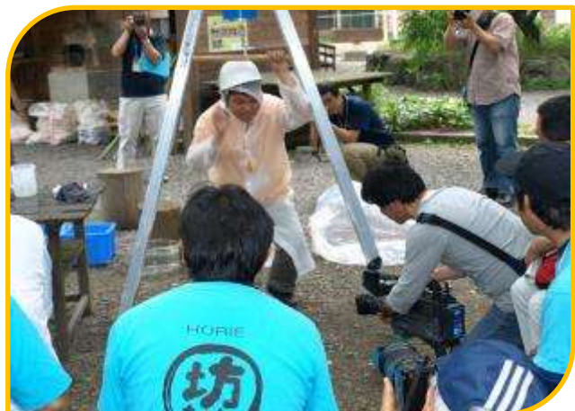
人の体重を支える大気のかってすごい！