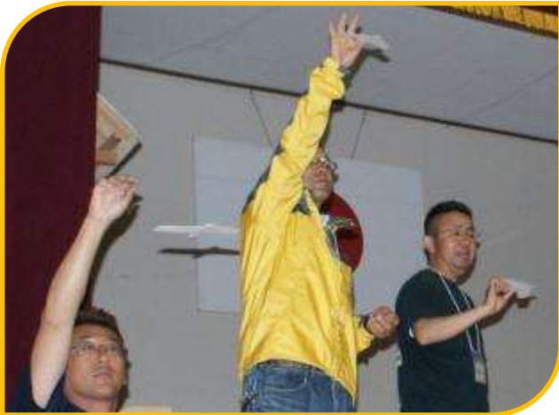
テイクオフの瞬間、真剣な表情です