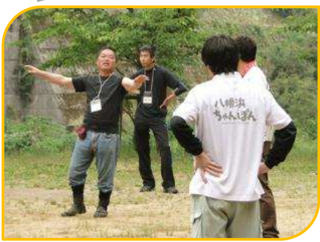
ルールを教え合うのも、おやし流！