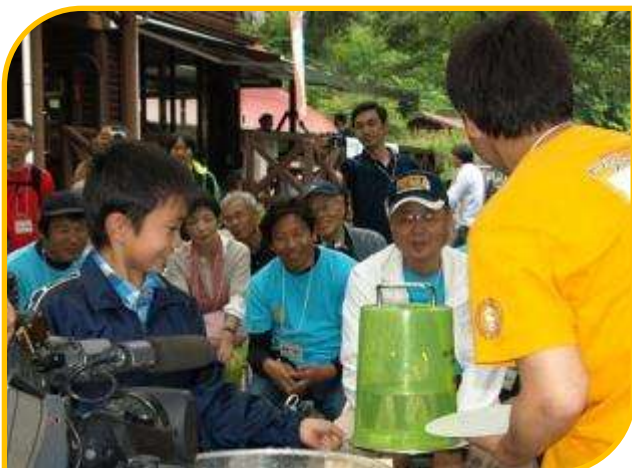
ひっくり返したバケツの水もこぼれない力