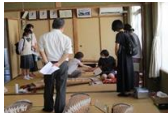
宇和高校三瓶分校 部活動（伝統芸能部）体験