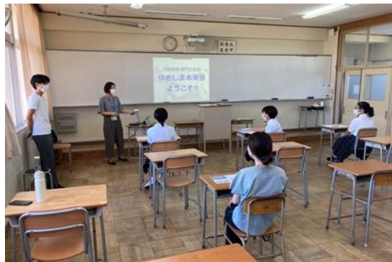
弓削高校 公営塾（ゆめしま未来塾）体験