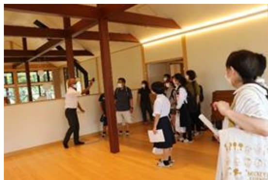
上浮穴高校 生徒寮（星天寮）見学