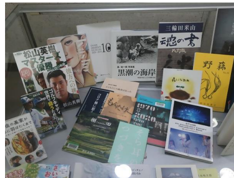
えひめ資料室ロビー展：2021年えひめ資料室収集資料（2022年4月1日～7月28日）