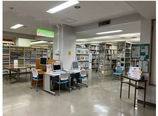
愛媛県立図書館 4 階 えひめ資料室