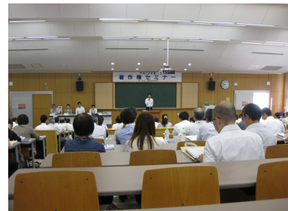
平成24年度著作権セミナー開催の様子