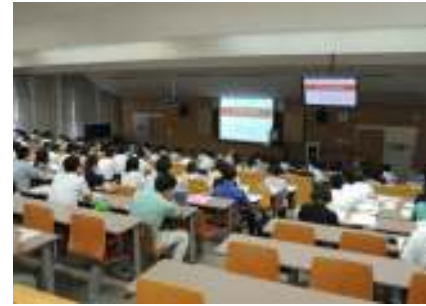
平成25年度著作権セミナー開催の様子