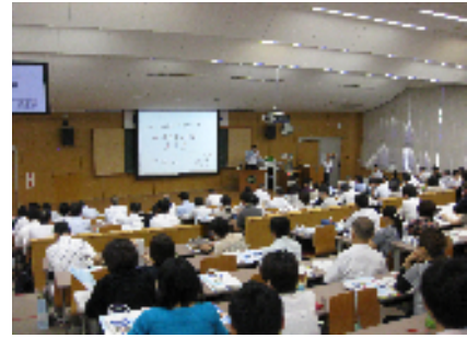
平成26年度著作権セミナー開催の様子