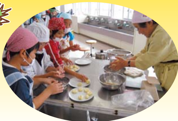
松山市立姫山小学校 「おばあちゃんと昔のおやつ作り」