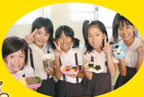
今治市立桜井小学校 「手作り弁当に挑戦」