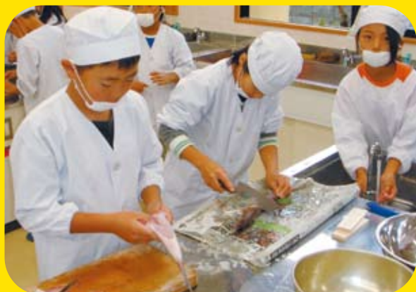
八幡浜市立江戸岡小学校 「みんなで作ってみよう ～かまぼこ作り～」