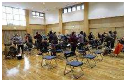
【経路ストレッチ教室で体操をしている様子】