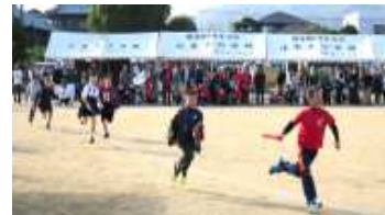
【各種団体対抗リレー】