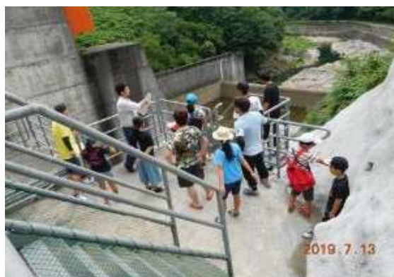
【早明浦ダムの見学】

9:00 出発 9:15~10:15 新宮ダム見学 11:15~12:00 早明浦ダム散策 12:00~12:30 昼食 12:30~12:45 着替え・カヌー準備 12:45~14:30 カヌー教室(汗見川) 14:30~15:00 片付け・着替え 15:00~16:00 移動・解散