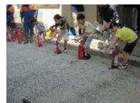
【水消火器で消火体験】