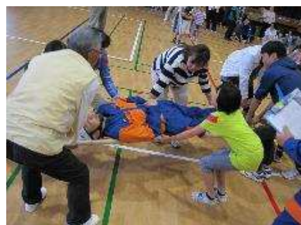
【身近なもので担架を作れ！けが人搬送競争】

防災運動会では、防災に役立つ競技を取り入れ、楽しみながら担架の作り方や応急手当の方法を学んでもらいました。また老人会女性部の協力で参加人数より少なめの炊き出しをしていただき、班全員にうまく炊き出しを配膳することができるか体験しました。来年もまた新しい競技を取り入れ、みなさんに参加してよかったと思っただけのようがんばりませう。