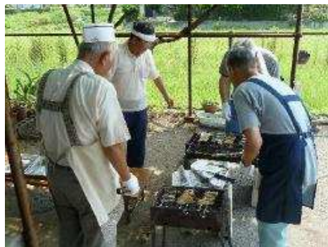
【本格的な鰻の蒲焼】