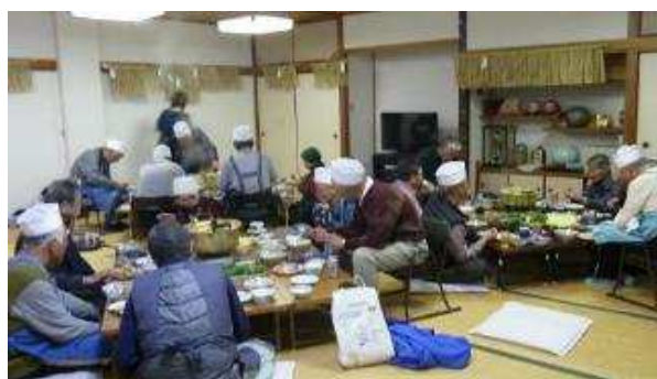
【しめ縄を頭上に忘年会】