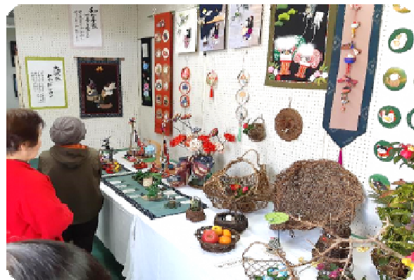
【作品展示: 地域の自然を感じる展示】