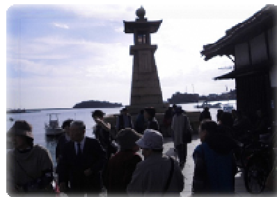
【 鞆 の 浦 】