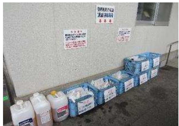
【 回収場所の様子 】