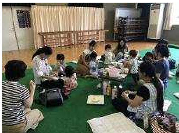
【かき氷を作ってミニ夏祭りを開催】