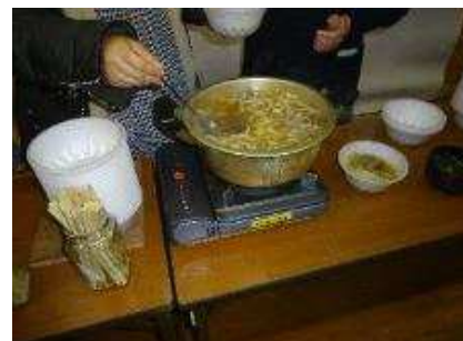
【表彰式後ふるまわれる、しし汁うどん】