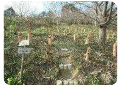
【里山ハニワ群】 (現在1200体)

また事業の一環として、久米地区各小学校の4年生を対象に1泊2日の野外活動キャンプを行っており、地域の方々のサポートを受けながら、集団・自然体験を通じて関わり合うことを体験し、仲間と一緒に自分のことは自分ですることを基本にし、子どもたちのチャレンジ精神を育てています。