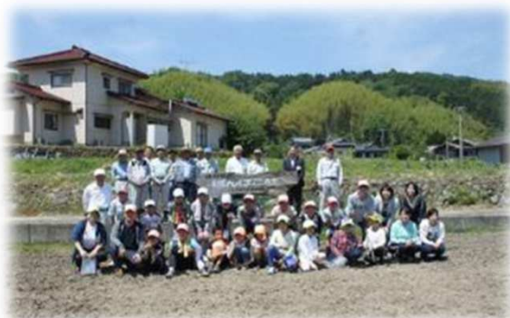
【ふるさと坂本塾メンバー】

古来、街道の要衝であった坂本地区は、昔ながらの遍路道や、道中の安全、土地の鎮守を願う寺社、伝統行事が数多く残されたまちである。また、日本三大たぬき話のひとつ、伊予の松山騒動・八百八狸物語の地であり、現在も隠(いぬ)神(がみ)刑部(ぎょうぶ)を祀る山口霊神で、毎年、法要とたぬき祭りが行われるなど、元祖「狸の郷」としても知られる。