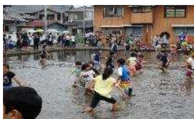
【しっぽとりゲーム】