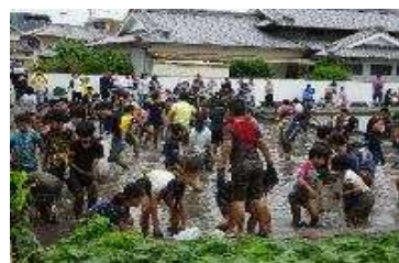
【うなぎのつかみ取り】