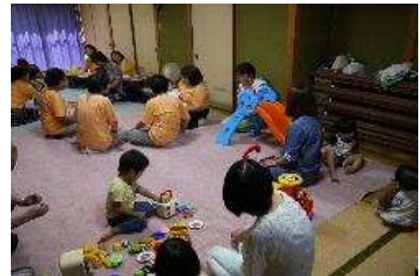
【紙芝居や絵本等の読み聞かせ】 子育てサロンゆうぐん (雄郡公民館)

会場は本館と分館を利用、各サロンともに月1回(ゆうぐん・毎月第3木曜日、どいだ・毎月第3月曜日、)午前10時から正午までの間、開催している。それぞれ地区住民有志がスタッフを務め、地域として子育てを支援している。