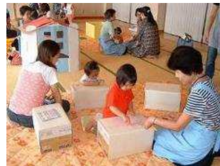
【お絵書きにダンボール箱を利用】 子育てサロンどいだ (土居田分館)

利用者同士の会話もはずみ、次第に友達になり、スタッフとの会話を通して悩みの解消、子育てについての知識を得る機会ができ、徐々に成果が出てきている。