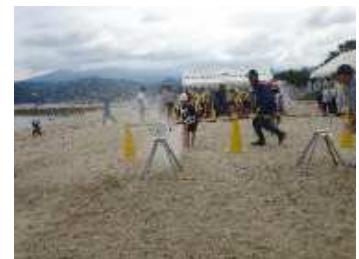
【 水消火器での訓練 】