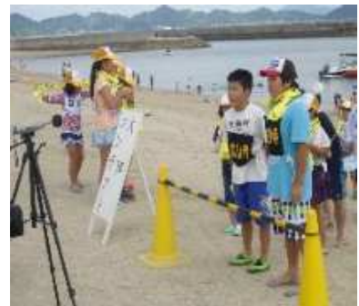
【 大声コンテスト 】

地域の皆さんの協力で、令和元年度も参加者や見学者らが親睦を深めていました。これからも災害意識を強くもち、地域住民とのつながりとなるよう、ずっと継続したいです。