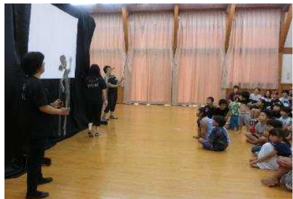
【影絵の鑑賞の様子】

この活動は、公民館、小学校、PTA、地域の役員や愛護班、高齢クラブのメンバーで実行委員会をつくり、事前準備から当日のサポートまで行います。子どもたちにとって思い出に残る1日となるよう、地域一丸となって取り組んでいます。