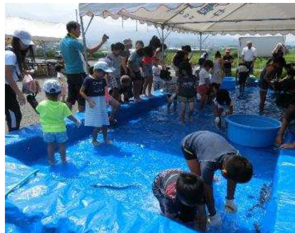
【うなぎのつかみどりの様子】