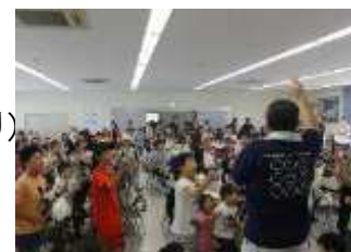
【ふれあいマーケットの様子】