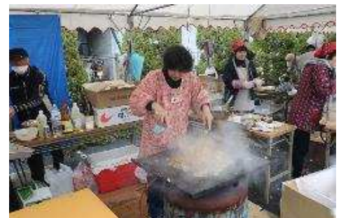
【各種団体によるバザー】

その他、屋外や公民館1階部分では、早朝から地域の体育会、愛護班、PTA、女性会などの各種団体によるバザーが行われており、大勢の人で賑わっています。また、公民館内には幼稚園、保育所、小学生の子どもたちの絵や工作、普段から公民館を利用している方々の書道、絵手紙などの作品をご覧になることもできるアットホームで和やかな雰囲気のみまつりです。