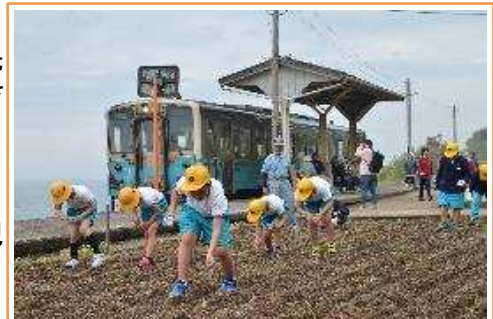
【4月24日 下灘駅内にある花畑にひまわりの種をまいています。児童達の想いが届き、夏には一面にひまわりの花が咲き誇っていました。】

平成23年度に設立された、JR下灘駅フィールドミュージアム運営委員会の協力を得て、活動をしています。