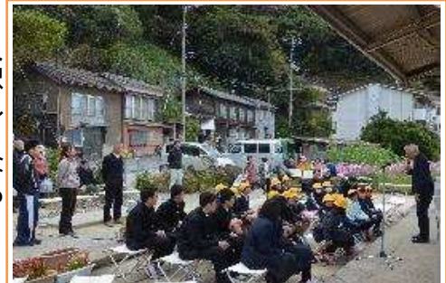
【12月6日 下灘駅花まつりを開催。たくさんの方にご来場いただきました！】