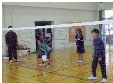
【ワンバンドバレー教室】