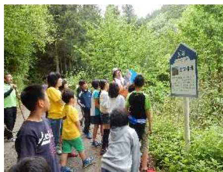
【広田ふるさと発見教室】

講師はできるだけ地元の方をお願いしており、令和元年度は、町文化財保護審議会委員や地元大学の教授、広田地区老人クラブ、町生活研究グループなどに依頼しました。