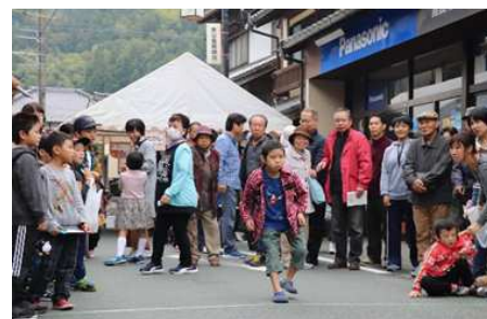
【柿のたね飛ばし大会】

それぞれの競技で、優勝・準優勝者にはJA柿選果場よりご提供いただいた、柿3kgが送られました。(たね飛ばしは優勝者のみ)