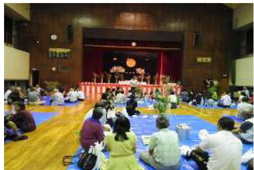
【お月様とススキがお出迎え】