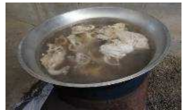
【出汁もしっかりとっています】

地域の皆様のご協力で、令和元年度も盛大に行うことができました。 ～絆～に感謝です。(主催者)