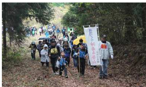
【頂上までもう一息!】