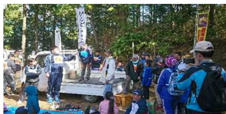
【思いを込めて大声を!】