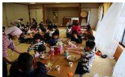
【カレーたくさん召し上がれ！】