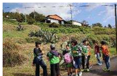
【この植物の名は何ですか？】

ボランティアグループに昼食づくりを依頼しました。カレーライスとデザートであっという間におなかいっぱいになりました。