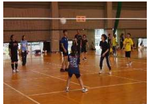
【レクバレーの一コマ】