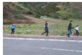
【初日の出と一緒に】