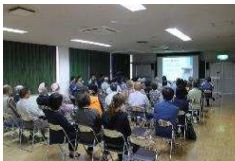
【講話・昨年の災害】

地域住民一人ひとりの防災意識を向上させるためには、次年度以降も防災フェスタを継続することが重要であると考え、次回の内容については住民の意見、他の地域で実施している事項を取り入れるとともに消防、市役所などとも連携して実施していきたいと考えている。