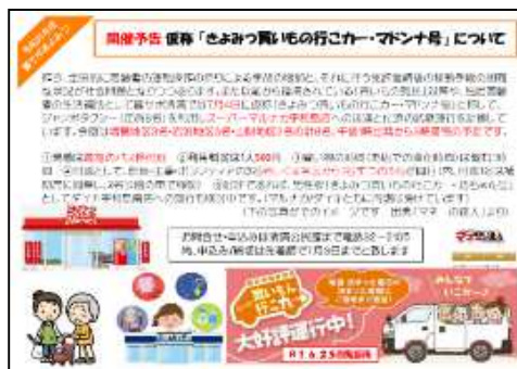
【買い物に行こカー チラシ】