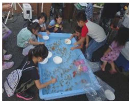
【地域住民による金魚すくいコーナー】