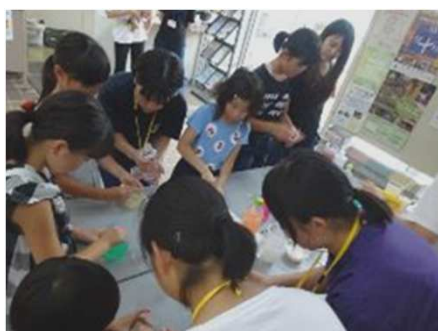
【中学生が運営しているコーナー】

今後はさらなるコンテンツ拡充を目指し、小学校やPTAとも連携し中学生にも準備・運営に参画させることで、このイベントを通じて社会性や経済感覚を育めるよう努力し続けたい。