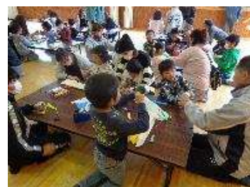
【慣れない作業に苦戦】

杵と臼を使った「餅つき」が、保護者のみなさんには好評です。これからも、地域・世代間の交流のため続けていきたいです。