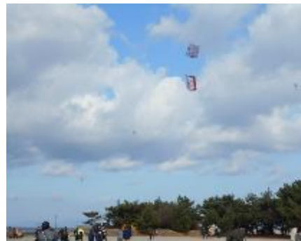
凧は天高く舞い上がりました