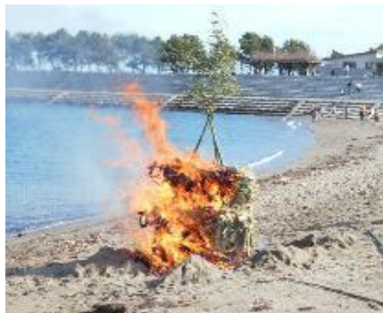
点火とともに歓声が巻き起こります

(1)長浜の子どもをみんなで育てる会とともに開催している「とんど焼き・凧揚げ大会」ですが、新春の1月の第2土曜日に毎年開催しています。とんど焼きでは、各家庭から、しめ縄や松飾りを持ち寄り、竹で組んだやくらに通して点火し、一年間の無病息災を一同で願います。その後、おぜんざいのお接待を行いながら、地域の青少年が一堂に会し、個人・団体戦と凧のデザインや上がり具合による審査会が繰り広げられます。少子高齢化が進む中、「凧揚げ大会で青少年の健全育成に尽力しよう」「おぜんざいの接待でご高齢のかたに『ほっこり』していただく」といった温かい雰囲気、大きな拍手や歓声とともに毎年会場全体を包み込みます。