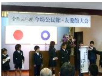
人権作文発表の様子