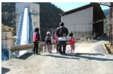
【何がつくられているのでしょうか？】