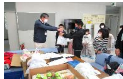
【よくがんばりました！】