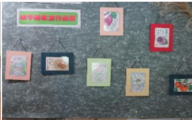
【出来上がった絵手紙を公民館に展示】