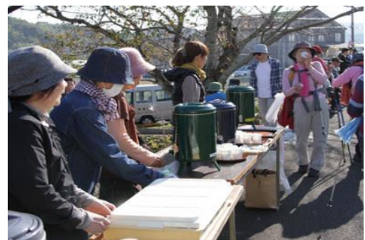
【各所で行われるお接待。】