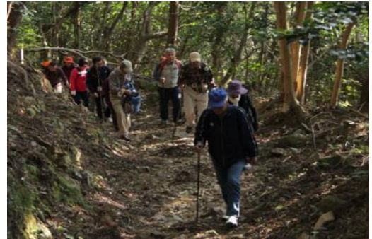
【自然豊かなへんろ道を歩く参加者】

このイベントの特色は、地域住民による「お接待」が各所で行われることです。蒸かし芋、みかん、じゃこ天、饅頭、お茶などが各所で参加者に配布され、「頑張ってください。」など、言葉の「お接待」も受け、豊かな自然と地域住民の温もりを感じながら歩く行程は、参加者の心を癒してくれるものだと思います。