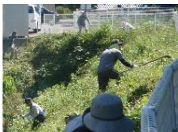
〈ホタルの里の清掃・除草活動〉

平成29年度の「ホタル観賞会・ホタルを知る会」は6月3日(日)に行われた。例年同様多くの方に参加していただき、体育館でのスライドを使ったホタルの勉強会や小学生による河川環境等の発表のあと、校庭では花火を楽しんだ。その後「ホタルの里」に移動しホタル観賞を行い、今年もたくさんのホタルが見られ、参加者からは大きな歓声が上がった。