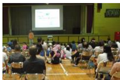
〈ホタルを知る会の様子〉