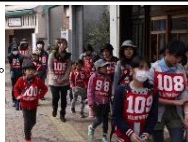
【サーキット実施風景】

当日、参加者は番町小学校グラウンドに集合し、準備体操、注意事項の確認等を済ませた後、番町地区スポーツ推進委員等関係者の誘導によって出発します。