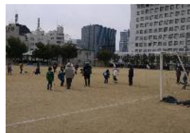
【グラウンド・ゴルフの様子】

また、28年度は番町小学校グラウンドにてニュースポーツである『グラウンド・ゴルフ』を行いました。大人から子どもまで、誰でも気軽に楽しめるスポーツになっております。