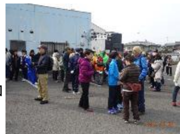
【朝の集合場所での一時】

目的地は、時間などを考慮し毎年変えているが、往復とも安全で安心できるルート及び休息が十分できる場所を選択している。